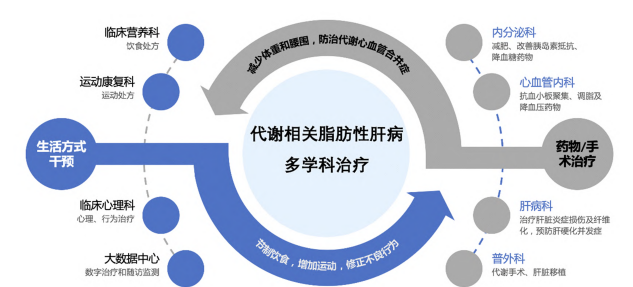
图 3 代谢相关脂肪性肝病的多学科治疗

MAFLD 的治疗需要多学科协作, 治疗对策为减少体质量和腰围、改善 IR、防治 MetS 和 T2DM、缓解 MASH 和逆转纤维化 (图 3) [1, 2, 5-6, 11, 79-80] 。所有 MAFLD 患者都需通过健康宣教改变不良生活方式, 并存代谢心血管危险因素和肝损伤时需要应用相关药物干预。减重呈剂量依赖方式改善 MAFLD 患者代谢紊乱和肝损伤, 减肥药、调脂药、降压药、降糖药、抗血小板聚集药的选择需兼顾心血管、肾脏和肝脏获益, 并关注肥胖-代谢相关肿瘤的预防。即使患者已发生肝硬化也应强化代谢心血管危险因素及其相关疾病的药物治疗。符合相关手术指征的 MAFLD 患者可以考虑代谢手术和肝移植手术 [1, 5-6, 11] 。