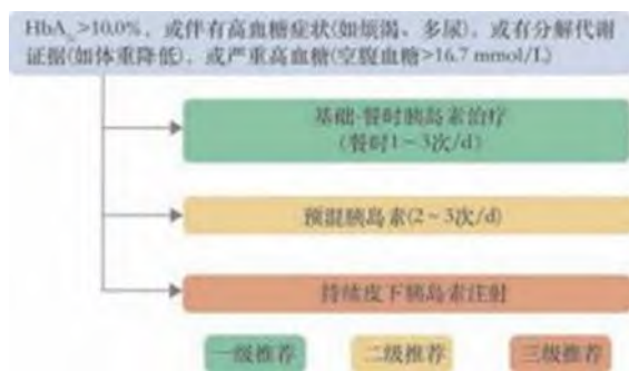
图 4 老年 T2DM 患者短期胰岛素治疗路径图