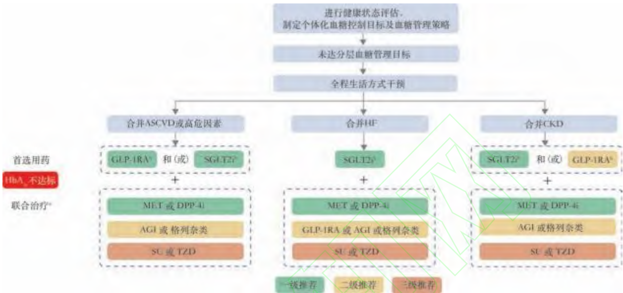
图 2 合并 ASCVD 或高危因素、HF 或 CKD 的老年 T2DM 患者非胰岛素治疗路径图