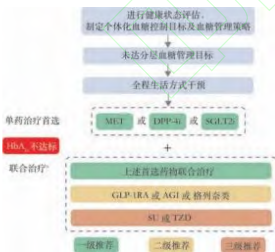
图 1 不合并 ASCVD 或高危因素、HF 或 CKD 的老年 T2DM 患者非胰岛素治疗路径图

健康状态综合评估结果为差(Group 3)的患者(包括临终前状态的患者), 不建议依据上述路径进行方案选择, 而应基于重要脏器功能、药物治疗反应、低血糖风险等, 制定相对宽松的血糖控制目标, 以不发生低血糖和严重高血糖为基本原则。要尊重患者及家属的意愿, 选择合适的降糖方案, 应用不易引起低血糖的口服药和/或长效(超长效)基础胰岛素(如甘精胰岛素 U100、德谷胰岛素、甘精胰岛素 U300 等)较使用一日多次速效胰岛素或预混胰岛素更为安全, 剂量也更容易调整, 不推荐使用低血糖风险高、减轻体质量的药物。