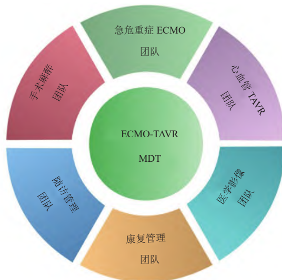
注: ECMO, 体外膜肺氧合; TAVR, 经导管主动脉瓣置换术; MDT, 多学科团队。

TAVR医师团队、手术麻醉医师团队、医学影像医师团队以及康复随访管理医师团队的ECMO-TAVR MDT协同执行(图1)。